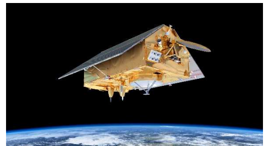
Figure 1. Satellite Jason-CS/Sentinel-6