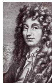
Christian Huygens (1629-1695)

Dans un premier temps, Huygens raconte qu'avec le grossissement utilisé, il voyait Jupiter à travers la lunette deux fois plus gros qu'il ne voyait la Lune à l'œil nu. Il estimait le grossissement de sa lunette à 164. Le diamètre apparent de la Lune à l'œil nu étant connu, il put estimer que celui de Jupiter était approximativement \alpha_J = 10^{-4} radians.