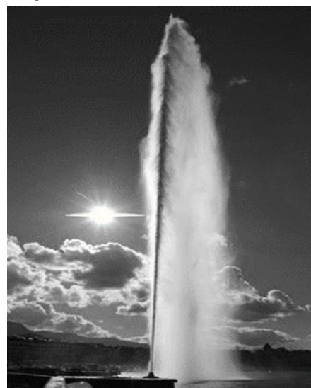
Figure 1. Jet d'eau de Genève