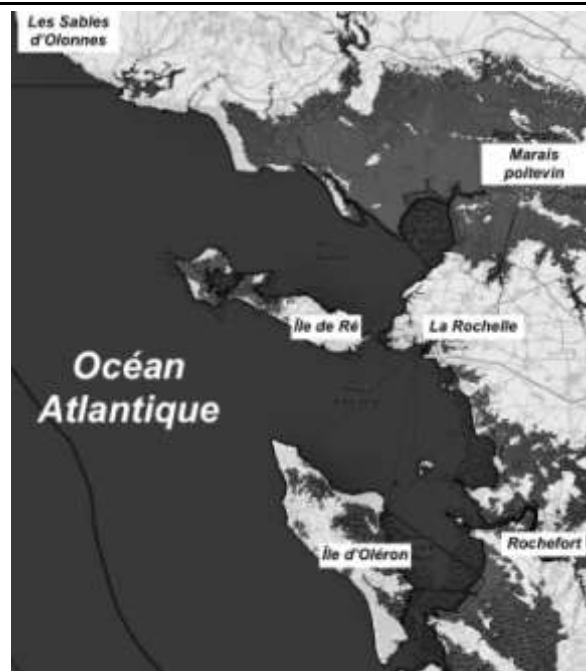
Élévation de 3 m en 2250