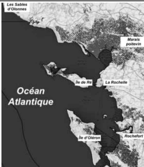
Élévation de 1 m