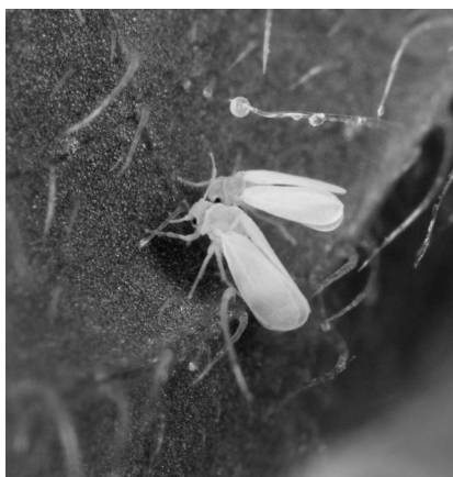
Aleurodes du tabac adultes, suçant la sève d'une feuille

L'aleurode du tabac ( Bemisia tabaci ) est un insecte qui se répand actuellement de manière importante dans de nombreuses régions du monde. Cet insecte suce la sève de plusieurs familles de plantes cultivées : Cucurbitacées, Fabacées, Malvacées ou Liliacées par exemple. Les dégâts occasionnés sont nombreux : déformation des feuilles, prolifération de champignons ou encore vecteur de virus.