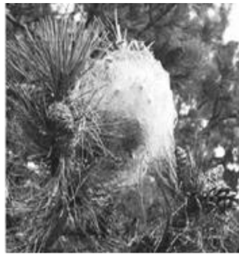
Cycle de vie de la chenille processionnaire (à gauche) et nids d'hiver (à droite).