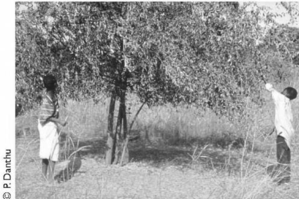
Figure 1. Cueillette de jujubes.

Le Jujubier Ziziphus sp est un arbre fruitier courant dans la zone Soudano-Sahélienne. Le fruit est consommé frais ou sec. Sa pulpe est très riche en glucides et en vitamines A et C. Les feuilles sont consommées comme légume et surtout comme fourrage d'appoint pendant la saison sèche. Son bois dense est facile à travailler pour la fabrication d'ustensiles de cuisine et d'outils. Dans des systèmes agroforestiers, il peut être exploité en banque fourragère, haie vive ou brise-vent.