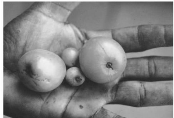
Figure 2. Jujubes de la taille d'une cerise (variété Golan) comparés à des jujubes d'une variété sahélienne.

Mais comme la plupart des arbres fruitiers, le Jujubier est à croissance lente et sa sylviculture est encore peu maîtrisée. On cherche à améliorer leur production de biomasse.