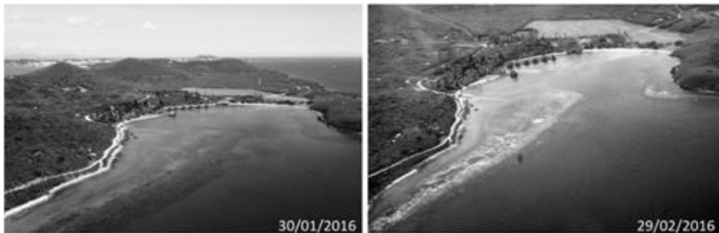
Figure 1 - Comparaison des deux vues aériennes de la baie du Kuendu Beach à Nouville, prises à la fin de janvier 2016 (à gauche) et à la fin de février 2016 (à droite) . Les tâches blanches visibles en 2016 correspondent au blanchissement massif des coraux.

En février 2016, la Nouvelle Calédonie a connu un épisode de blanchissement massif de ses récifs coralliens.