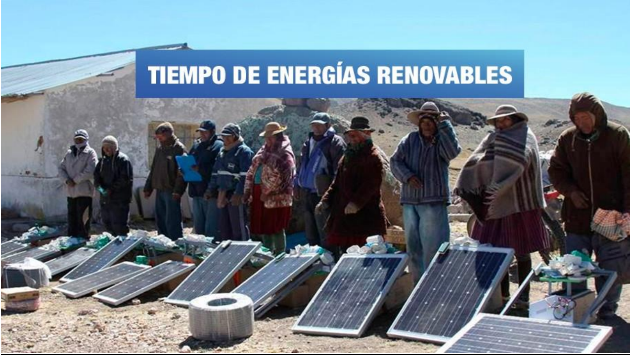
https://wayka.pe/ , 22/03/2018

Energías renovables ya: conoce la clave que permitirá al Perú cumplir con el Acuerdo de París