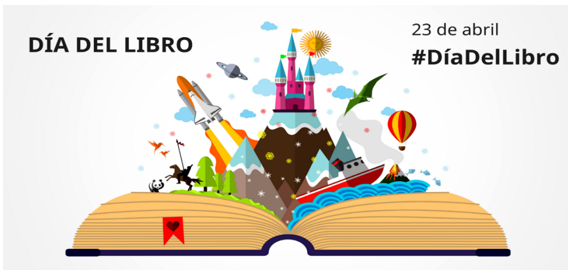
Cartel del Día del libro 2021

Muestre la relación que existe entre este cartel y los documentos 1 y 2.