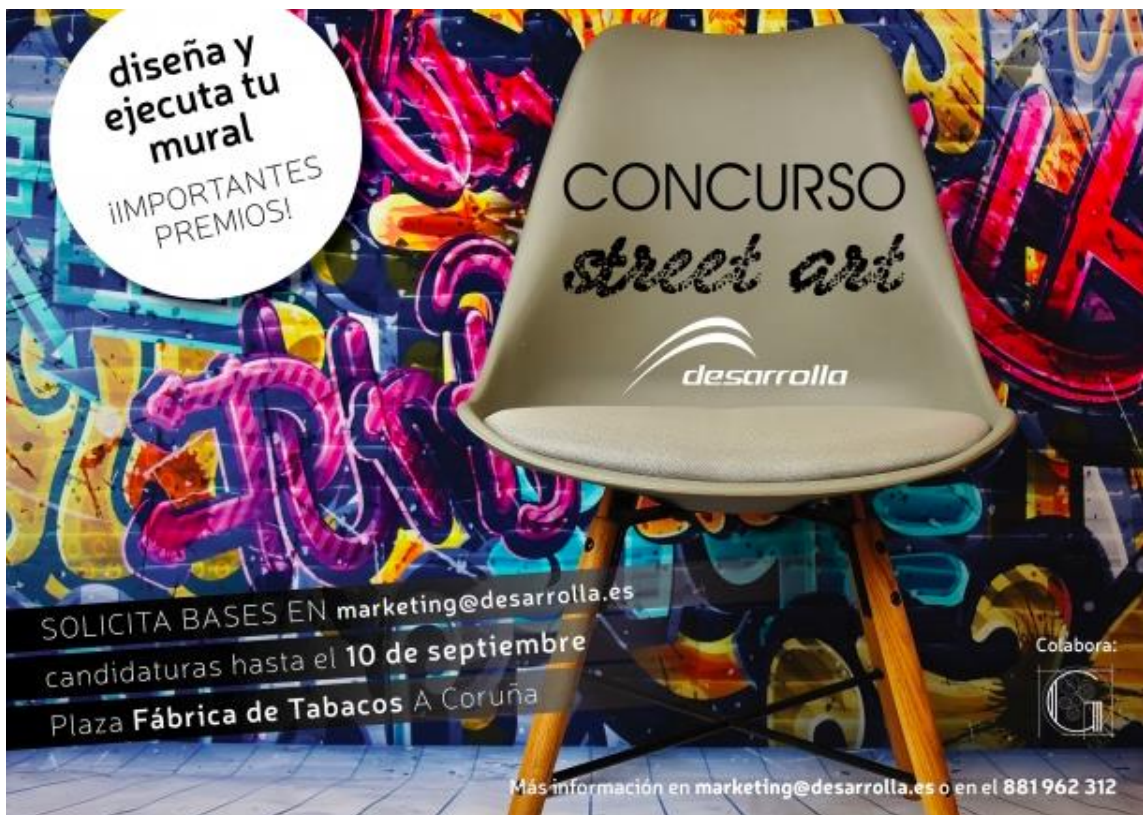
Cartel concurso de Desarrolla , empresa de construcción, 09/2018.

Apoyándose en el cartel de la empresa de construcción Desarrolla , explique qué concepciones del arte se oponen en los tres documentos.