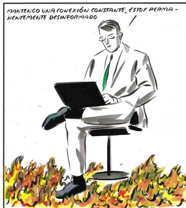
El Roto (caricaturista español), El País , 15/11/2018.