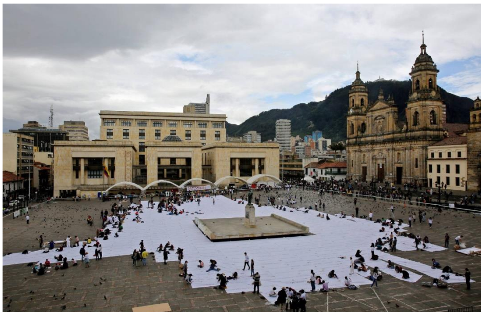
Leonardo Muñoz Agencia EFE