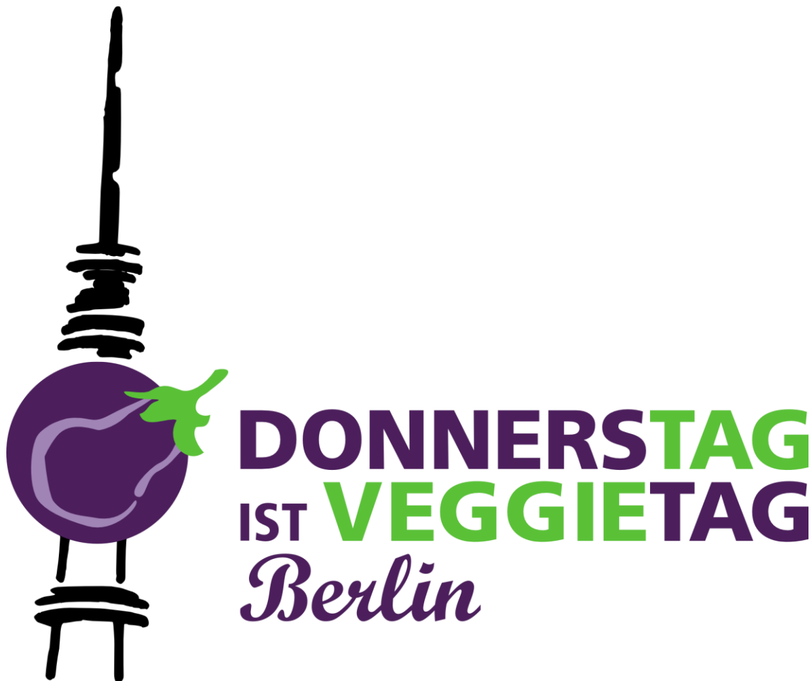
Abbildung für die Initiative der Stadt Berlin „Donnerstag ist Veggietag Berlin“