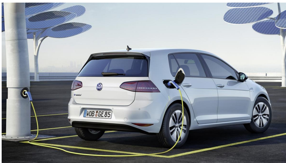
Abbildung für die Medienkampagne: Volkswagen bringt endlich den E-Golf auf den Markt (Foto: vw)

Aus: https://www.handelsblatt.com/auto/test-technik/volkswagen-e-golf-im-fahrbericht-bremsen-ist-fast-ueberfluessig/9596430.html?ticket=ST-10599178-dpVts9lkXzEwd16VT01j-ap1