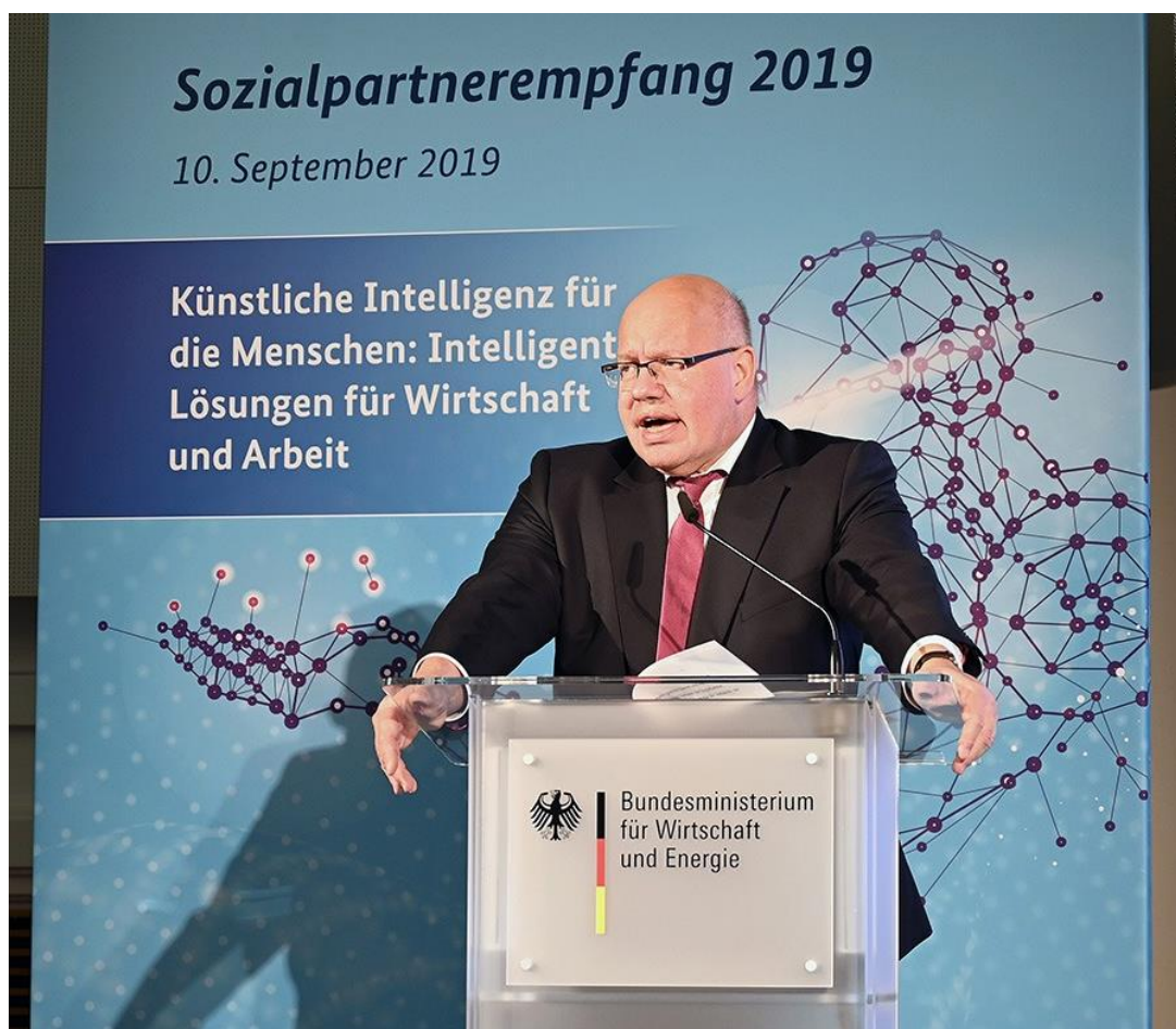
Foto – Rede – September 2019 – Künstliche Intelligenz für die Menschen: Intelligente Lösungen für Wirtschaft und Arbeit. Peter Altmaier: deutscher Politiker und seit dem 14. März 2018 Bundesminister für Wirtschaft und Energie im Kabinett Merkel IV