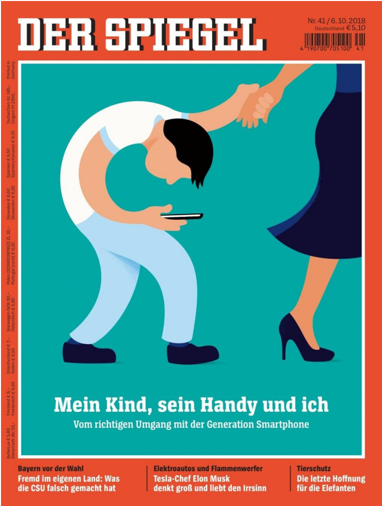
Titelseite – Der Spiegel – Oktober 2018

Mein Kind, sein Handy und ich. Vom richtigen Umgang mit der Generation Smartphone.