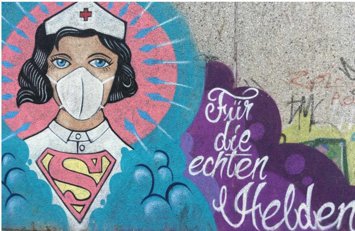
Foto – Street Art in Hamm