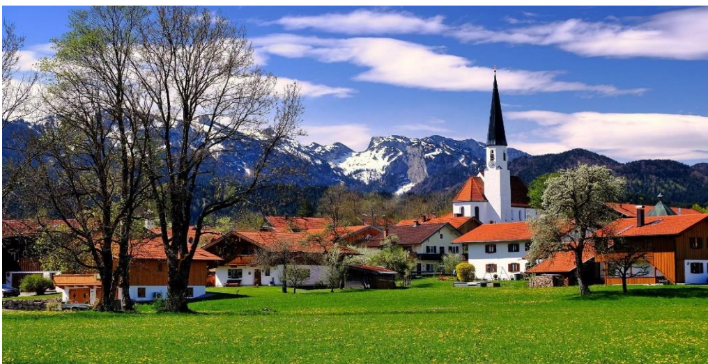
Arzbach in Bayern