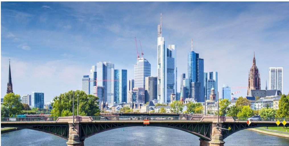
Skyline – Frankfurt am Main

„Ich hatte damals keine große Lust, in die Provinz zu fahren.“ Der Autor hat seine Meinung geändert. Was denken Sie? Würden Sie lieber in einer Großstadt oder auf dem Land leben? Was sind die Vorteile und Nachteile? Begründen Sie Ihre Meinung.