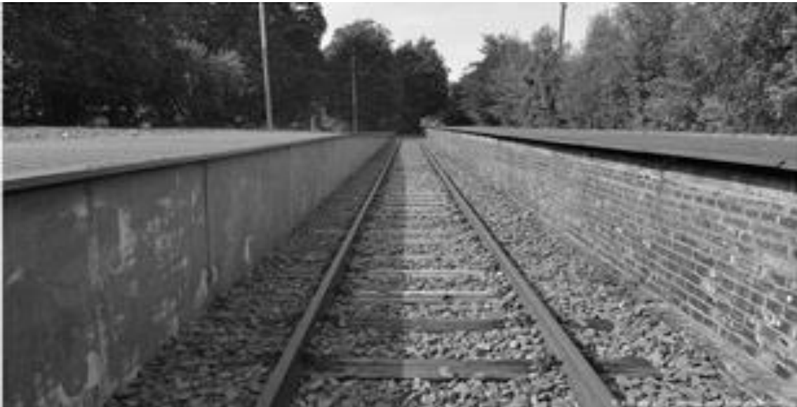
Ein beeindruckender Ort: Das Mahnmal Gleis 17 in Berlin Grunewald

10 Und Beynisch erinnert sich zudem an seine Besuche am Gedenkort Gleis 17 im S-Bahnhof Grunewald. Zehntausende Juden fuhren von hier aus mit der Bahn in den Tod. „Da spüre ich schon Traurigkeit. Diese Atmosphäre an diesem einen Gleis, die Pflanzen, die Stille.“