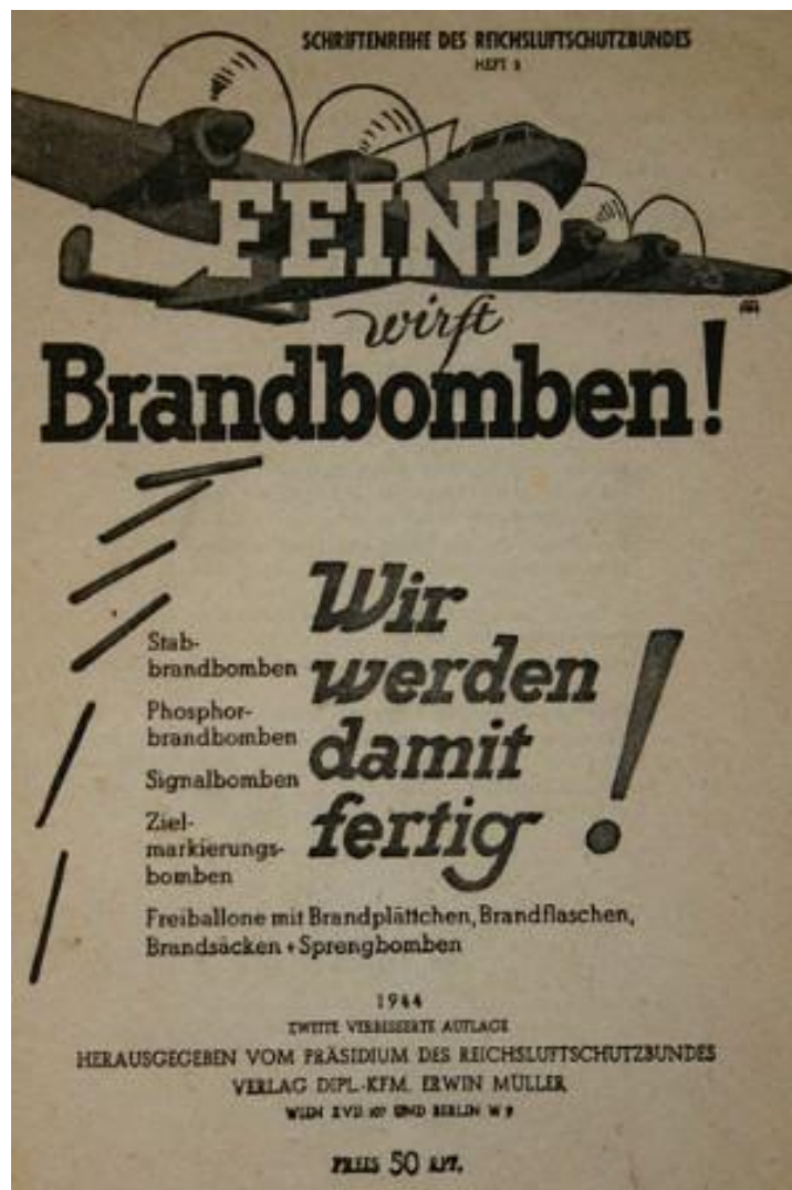
Wir werden damit fertig , Propaganda-Broschüre des Reichsluftschutzbundes, 1944