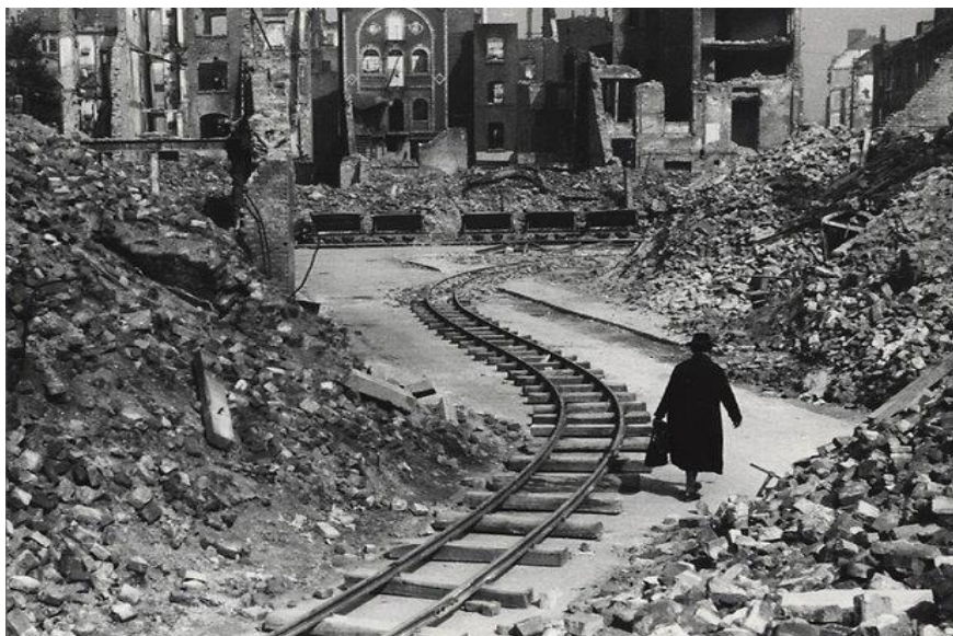
„Die Stunde Null“, Ritterstraße in Köln um 1947

Erklären Sie, warum es wichtig ist, dass wir uns heute noch an die Vergangenheit erinnern. Sie können sich dabei auf das Foto stützen.