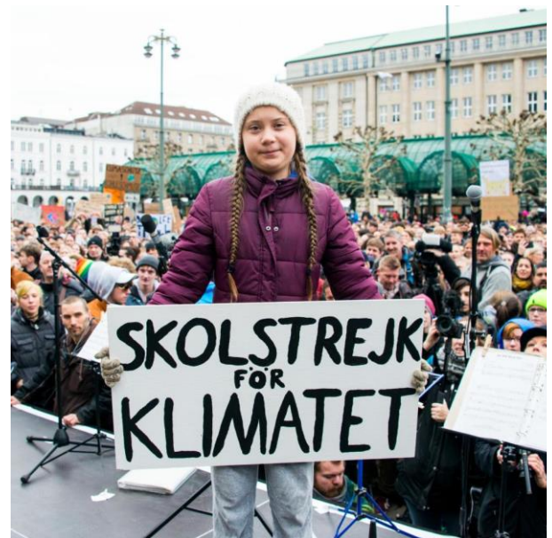
Greta Thunberg, Klimaaktivistin „Schulstreik für das Klima“ Stockholm, März 2019