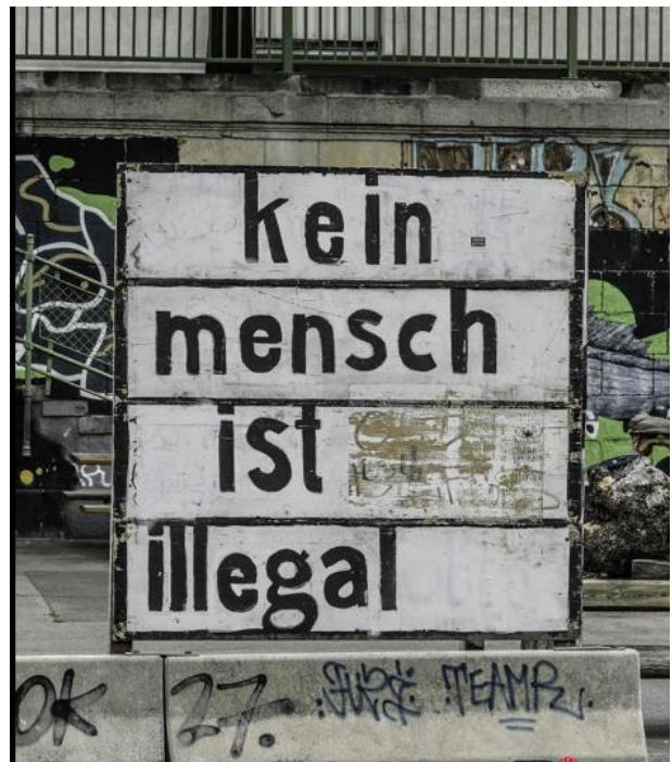
„Kein Mensch ist illegal“ Streetart-Logo für Antirassismus Berlin 2019