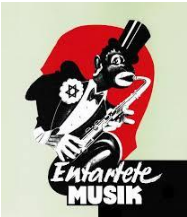
„Entartete Musik“ Plakat zur Ausstellung Düsseldorf 1938

„Am 4. Januar 1995 verlegte der Künstler ohne Genehmigung der Behörden die ersten Steine in Köln“. Muss Kunst immer legal sein? Wie stehen Sie dazu? Geben Sie konkrete Beispiele.