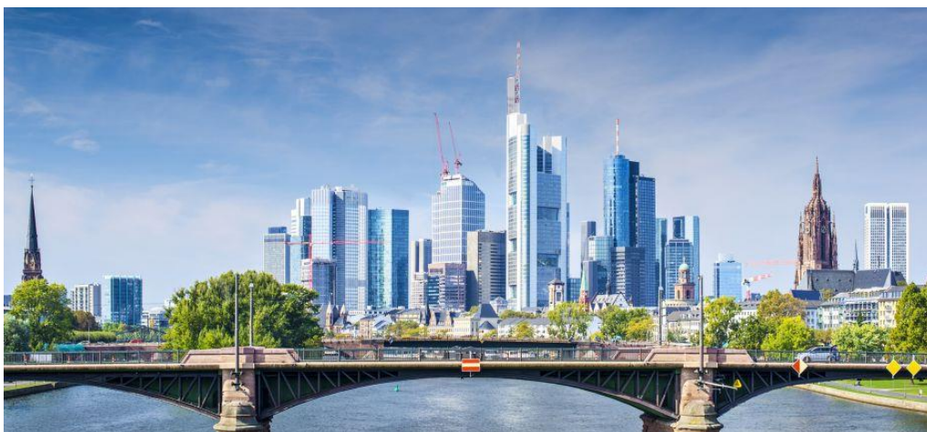
Skyline – Frankfurt am Main

Warum ist dieser Trend problematisch und was könnte man dagegen unternehmen? Argumentieren Sie und geben Sie konkrete Beispiele.